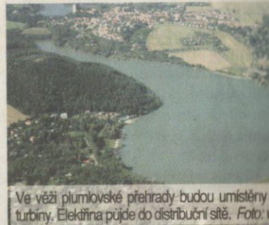
Ve věži plumlovské přehrady budou umístěny turbíny. Elektrárna půjde do distribuční sítě. Foto: ...

PLUMLOV Nová vodní elektrárna by se ještě letos měla začít budovat na plumlovské přehradě. Vznikne ve věži vodního díla. Stavba za sedmáct milionů korun proběhne v rámci rekonstrukce výpusti nádrže. Povodí Moravy plánuje i další investice.