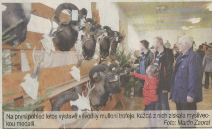
Na první pohled letos výstavě vévodily mufoní trofeje, každá z nich získala mysliveckou medaili.

Divočáci v zemědělství působí poměrně značné škody. I proto myslivci vítají, že od začátku nového roku je možné až na určité výjimky dospělé divočáky lovit celoročně. „Černá zvěř se ve velkém množí i díky mírnějším zimám a zejména dotací politiky a z toho vyplývající skladbě pěstovaných plodin. V tomto ohledu mizí